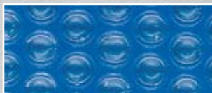
bleu 300, 400 et 500 microns

Retirer totalement la couverture avant la baignade. Ne pas marcher ou s'allonger sur la couverture, ne pas nager dessous.