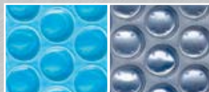
bleu 400 microns Face envers argent