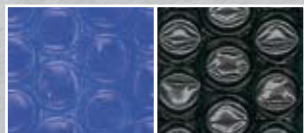
bleu 400 microns Face envers noire